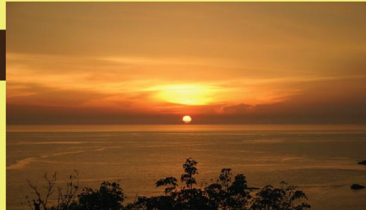
PEMANDANGAN MATAHARI YANG TERBENAM DIRAKAM DI BALAI CERAP AL AL-KHAWARIZMI, TANJUNG BIDARA MELAKA

"Dan ia memudahkan bagi kamu malam dan siang, dan Matahari serta Bulan, dan bintang-bintang dimudahkan dengan perintahNya untuk keperluan -keperluan kamu."